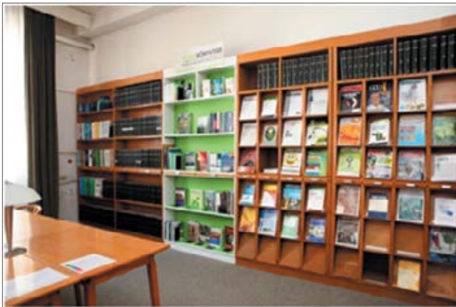
2. ábra. A Szent István Egyetem Kosáry Domokos Könyvtár és Levéltár klímakönyvtári részlege 2011-ben

A felsőoktatási könyvtárak között 2011-ben a Szent István Egyetem Kosáry Domokos Könyvtár és Levéltárában a British Council adományának jóvoltából – jórészt országosan hozzáférhető – klímakönyvtár létesült, amely a legkülönbözőbb oldalakról járja körül a klímavédelem témáját. 71 (2. ábra)