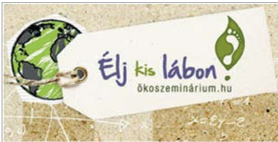
3. ábra. Az ELTE fenntarthatósági kampányának felhívása

Emellett a munkacsoport kiemelt hangsúlyt helyezett a 2011–2012-es tanévben az ELTE Bölcsészettudományi Karán Ökoszeminárium címmel megrendezett fenntarthatósági szemléletformáló kampány 72 népszerűsítésére, ami részben előadások szervezését, valamint, könyvtári szinten, a könyvtári intézmények olvasószolgálati pultjánál elhelyezett ökoszemináriumi ismertetőkérdőív osztását, a programban való részvétel ösztönzését jelentette. (3–4. ábra)