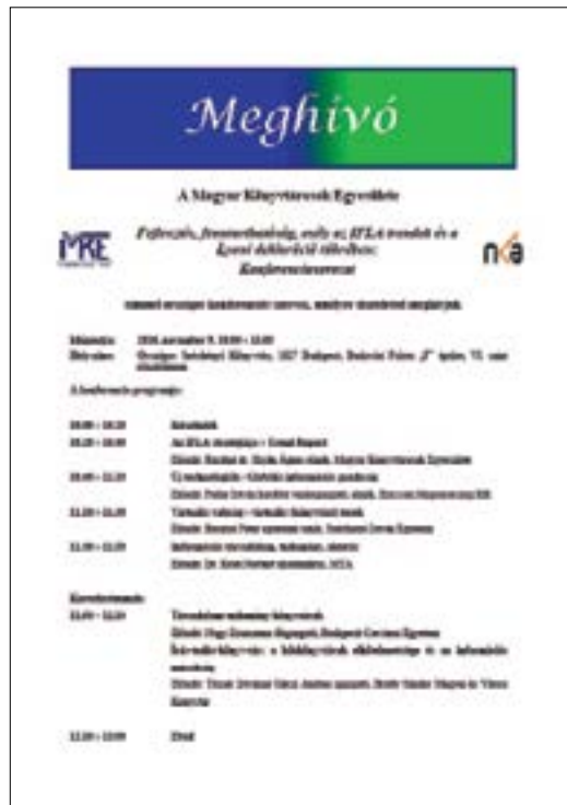
6. ábra. A Magyar Könyvtárosok Egyesülete által 2016. november 9-én rendezett Fejlesztés, fenntarthatóság, esély az IFLA trendek és a Lyoni deklaráció tükrében című konferencia meghívója

A kezdet folytatásra talált, és a Magyar Könyvtárosok Egyesülete 49. Vándorgyűlésén (2017. július 6.) a Mezőgazdasági szekción belül a téma ugyancsak helyt kapott. 77 Az ELTE Egyetemi Könyvtár az idei évben hatodik alkalommal rendezte meg konferenciával egybekötött Zöld utat a jövőnek – Hagyományok és kihívások VI. című szakmai napját, amely – miként a jelen kötet is bizonyítja – a fenntarthatóság és a könyvtárak kapcsolatát járta körül a különböző (tudomány) területek és szakmák ismeretanyagának segítségével. 78 S végül, de nem utolsósorban az idei rendezvények közé tartozik az Országos Könyvtári Napok újabb