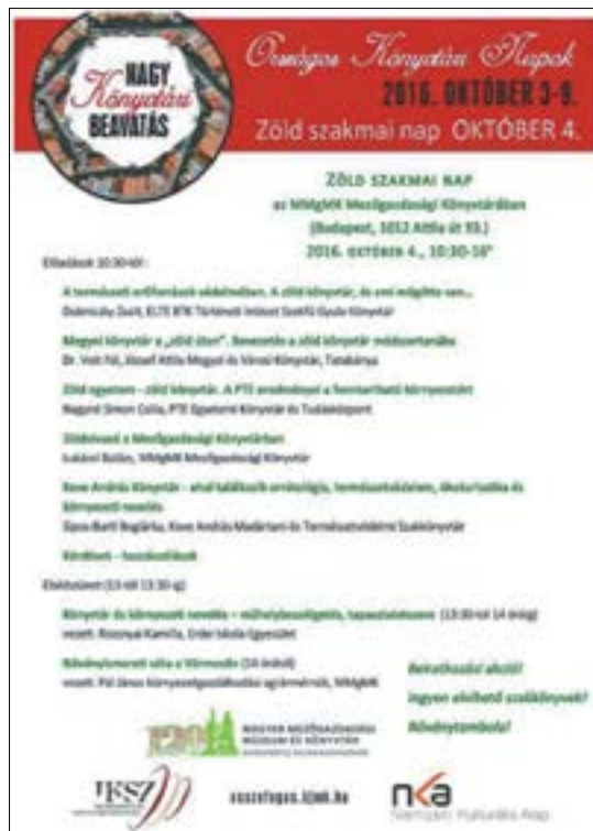
5. ábra. A Magyar Mezőgazdasági Múzeum és Könyvtár Mezőgazdasági Könyvtár 2016. október 4-én rendezett Zöld szakmai napjának meghívója

zat központi témája ebben az évben a zöld könyvtárak és a környezettudatosítás könyvtári lehetőségei és eszközei voltak, amelynek keretében a Magyar Mezőgazdasági Múzeum és Könyvtár Mezőgazdasági Könyvtára egy zöld szakmai konferenciát és találkozót rendezett 2016. október 4-én. 75 (5. ábra)