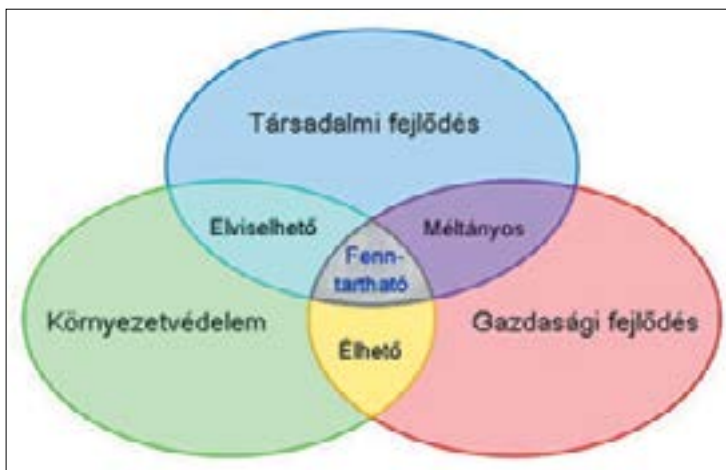
1. ábra. A fenntartható fejlődés vázlata

Az eddigi megállapodások sikeressége persze leginkább azon múlik, hogy a nagy célokat mennyire sikerül lebontani a mindennapi gyakorlatokra, mennyire sikerül beépíteni az egyes országok stratégiáiba és átültetni az állampolgárok gondolkodásába.