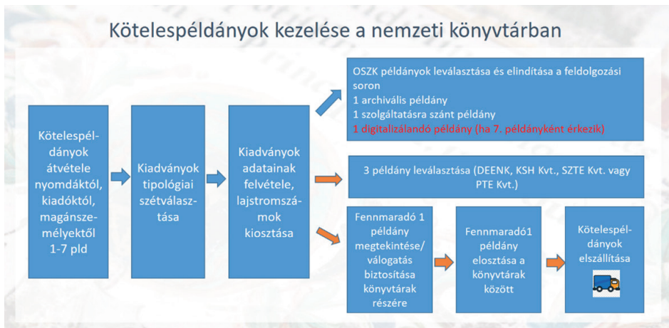
2. ábra. Kötelesspéldányok kezelése a nemzeti könyvtárban

A nyomdaktól, kiadóktól, szerzőktől vagy egyéb közreműködőktől beérkezett nyomtatott vagy fizikai hordozón megjelent elektronikus kötelesspéldányok kezelésének folyamatát az 2. ábrán lehet nyomon követni. A kötelesspéldányok átvétele, a szállítólevelek és kiadványok ellenőrzése, a kiadványtípusok szétválasztása, a kiadványok alapadatainak felvétele, lajstromszámokkal való ellátása és a különböző könyvtárak példányainak leválogatása a Kötelesspéldány- és Kiadványazonosító-kezelő Osztályon történik. Az OSZK archív, szolgáltatásra szánt és digitalizálandó példányainak leválasztása már a feldolgozási futószalag következő állomásán, a Gyarapítási és Állomány-nyilvántartó Osztályon zajlik. A nemzeti könyvtárak példányainak leválasztása után 3 példány azonnal a 4 kiemelt könyvtár (DEENK, KSH Könyvtár, PTE EKTK, SZTE Klebelsberg Könyvtár) kijelölt polcára kerül. A DEENK és a KSH Könyvtár teljes sort kap a kötelesspéldányokból, míg a PTE EKTK és az SZTE Klebelsberg Könyvtár egy teljes kötelesspéldánysoron osztozik, a két könyvtár által kötött gyűjtőköri megállapodás alapján.